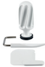
RÜHRWALZE, TEIGABSTREIFER, TEIGSPACHTEL