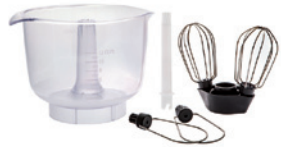
KUNSTSTOFFRÜHRSCHÜSSEL 3.5 LITER MIT PLANETENSCHLAGWERK