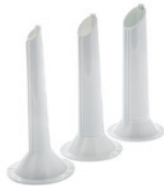
WURSTSTOPFER 10 / 20 / 25 MM