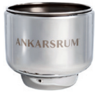
EDELSTAHLRÜHRSCHÜSSEL 7 LITER